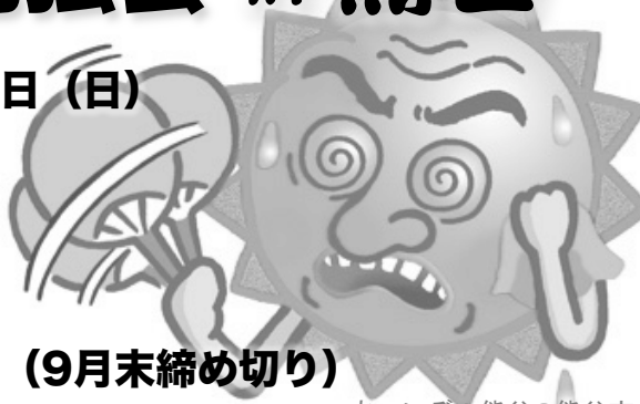
あついぞ！熊谷

勉強会のみ … 500円 会費：勉強会・懇親会 … 4,000円 勉強会・懇親会・宿泊 … 12,000円 (9月末締め切り)